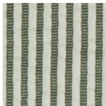
03935.003 ARMY GREEN