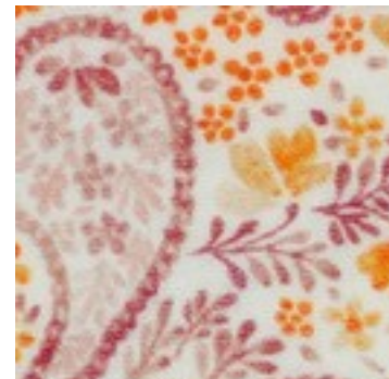
06870.012 WHITE/ OLD BLUSH