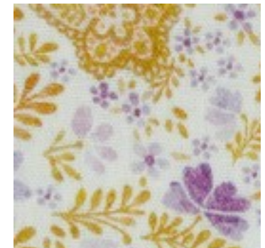
06870.013 WHITE/ LAVENDER