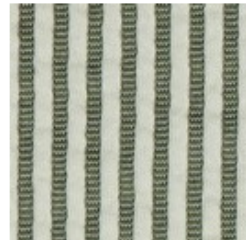
03935.003 ARMY GREEN