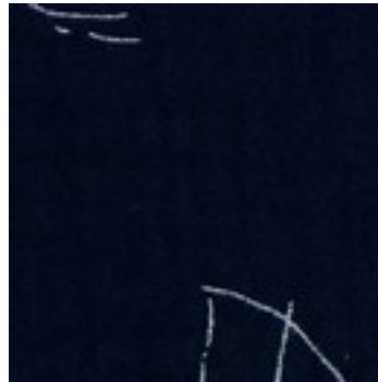
06917.005 DARK COBALT