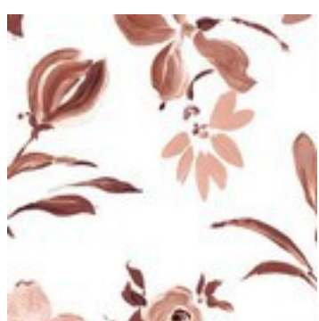
06458.001 WHITE/ MAUVE