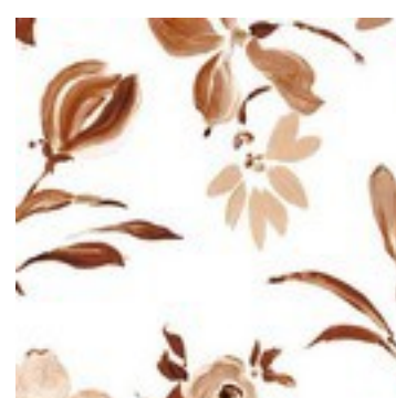
06458.010 WHITE/ DARK APRICOT