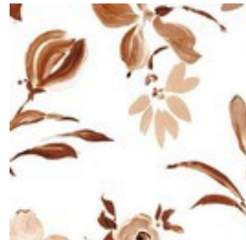
06458.010 WHITE/ DARK APRICOT