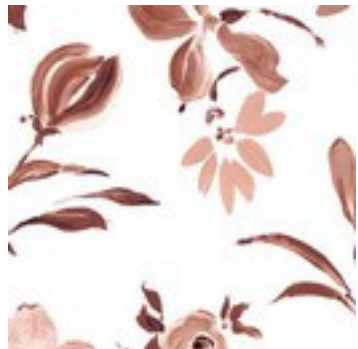
06458.001 WHITE/ MAUVE