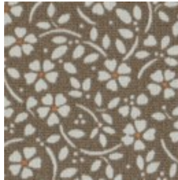
06860.013 MOSS GREEN