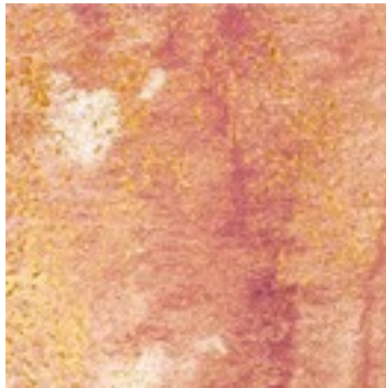
06640.001 SALMON / GOLD