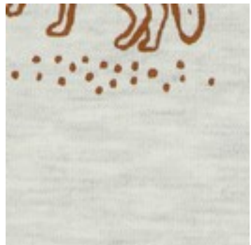
06946.001 ECRU MELANGE