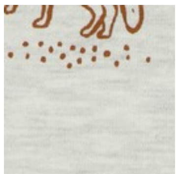
06946.001 ECRU MELANGE