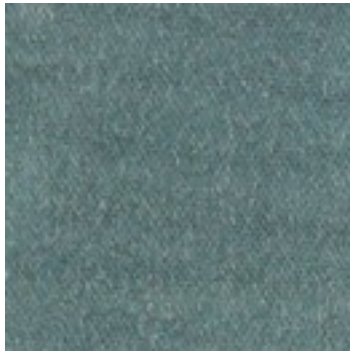
09744.007 ROCK GREY