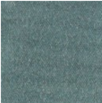
09744.007 ROCK GREY