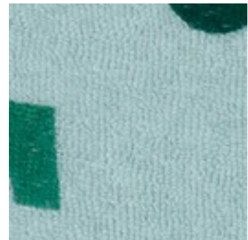
09581.006 OLD BLUE