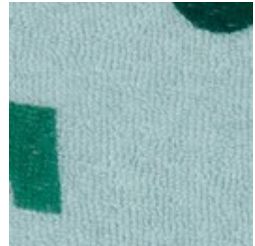
09581.006 OLD BLUE