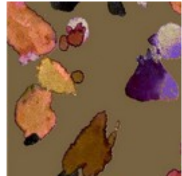
09978.007 LIGHT BROWN