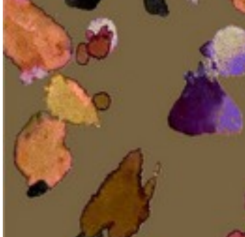
09978.007 LIGHT BROWN