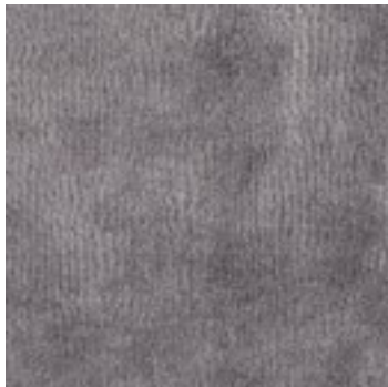
08048.033 DARK GREY