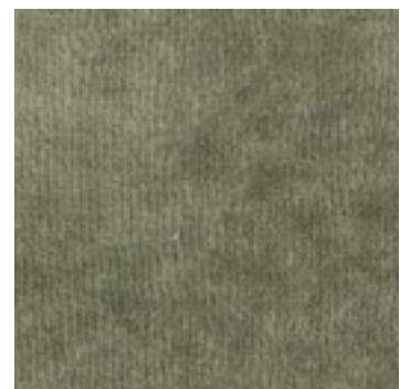
08048.039 MOSS GREEN