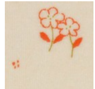
09824.005 LIGHT SALMON