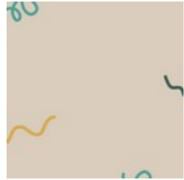
09923.015 LIGHT SAND