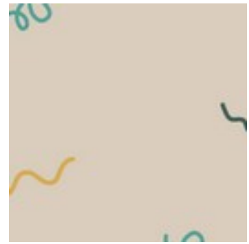
09923.015 LIGHT SAND