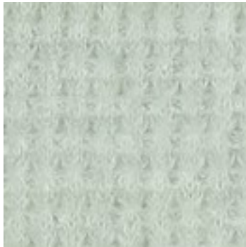
09048.001 LIGHT GREY