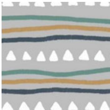
09935.014 LIGHT GREY