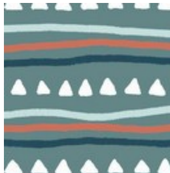
09935.018 BLUE SHADOW