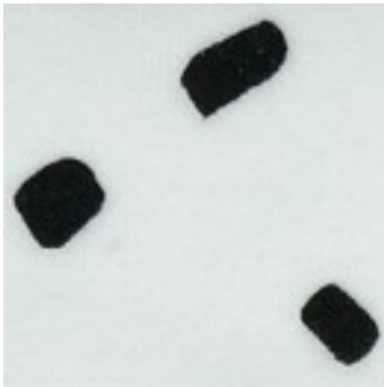
09822.002 OFF WHITE