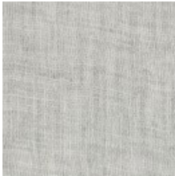
09716.001 ECRU MELANGE