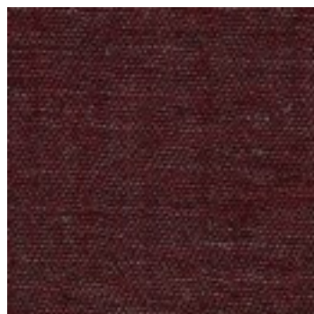
09716.010 BERRY MELANGE