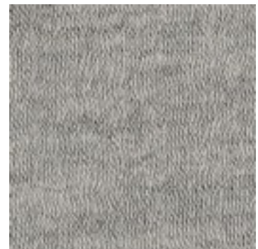
09716.006 SAND MELANGE