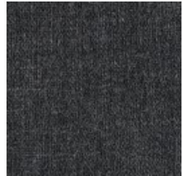
09716.003 DARK GREY MELANGE