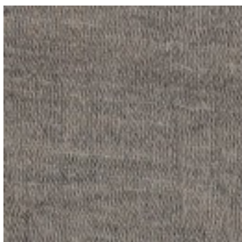
09716.007 TAUPE MELANGE