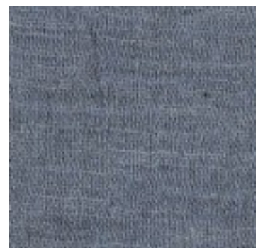
09716.011 JEANS MELANGE