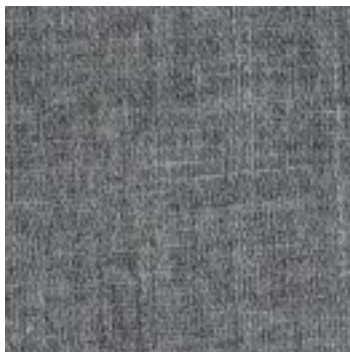
09716.004 GREY MELANGE