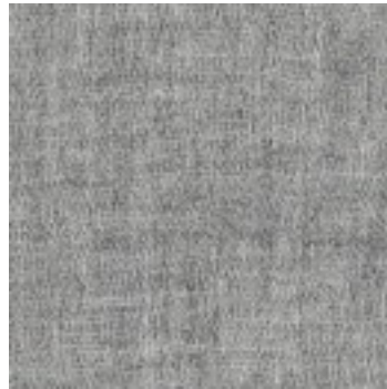
09716.002 LIGHT GREY MELANGE