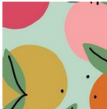
09513.002 LIGHT MINT