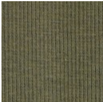
08492.034 ARMY GREEN