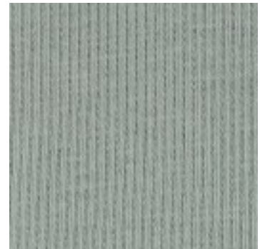
08492.036 OLD GREEN