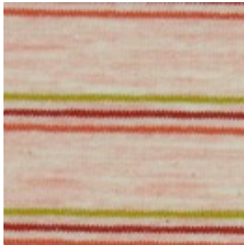
08886.004 ROSE MELANGE