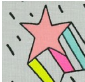
08971.002 LIGHT GREY