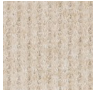
09048.007 LIGHT SAND