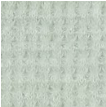
09048.001 LIGHT GREY