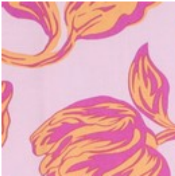
05495.001 LIGHT PINK