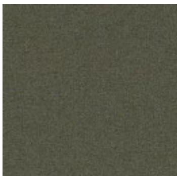
05124.029 ARMY GREEN