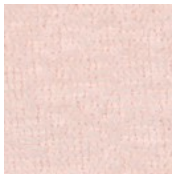
01882.039 LIGHT ROSE