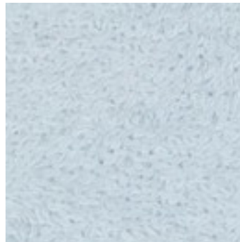
01882.005 LIGHT BLUE