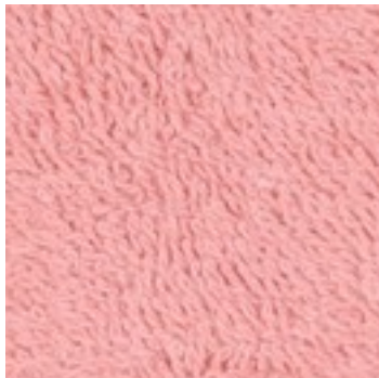
01882.053 OLD ROSE