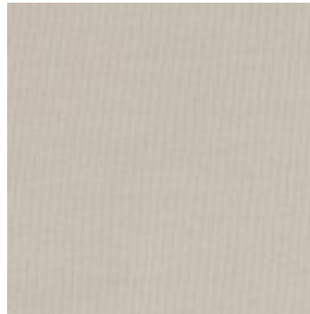
05828.004 LIGHT SAND