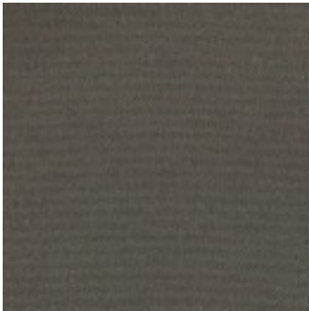
05924.003 ARMY GREEN