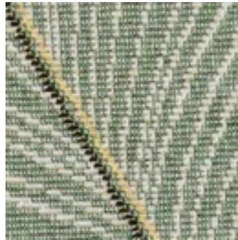
03334.003 SAGE GREEN