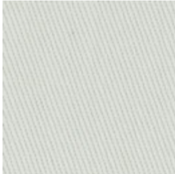
01786.020 LIGHT GREY