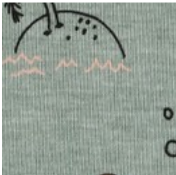
04133.017 DARK MINT MELANGE