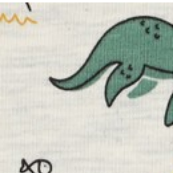
04133.001 ECRU MELANGE