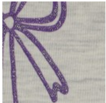
04121.001 ECRU MELANGE