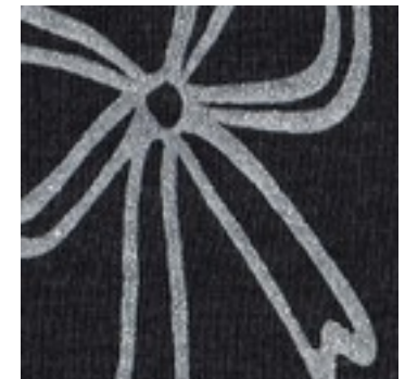
04121.005 INDIGO MELANGE