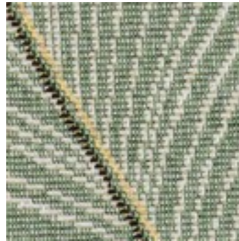
03334.003 SAGE GREEN