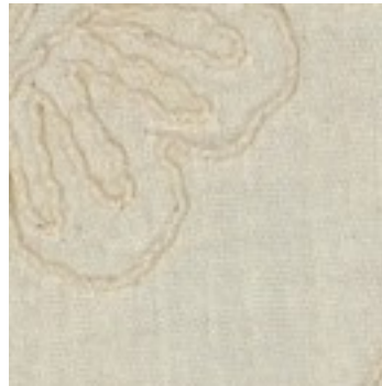
03649.062 NATURAL WASHED