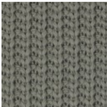
03331.004 OLD GREEN