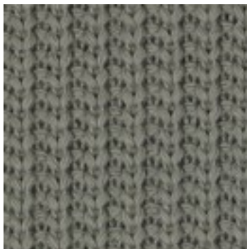
03331.004 OLD GREEN