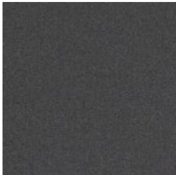
05124.021 DARK GREY