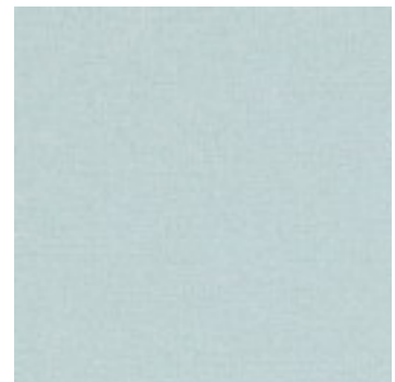
05124.012 LIGHT BLUE