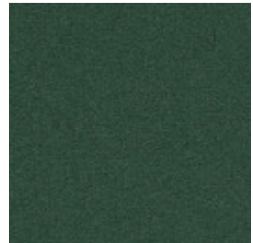
05124.025 DARK GREEN