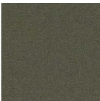
05124.029 ARMY GREEN