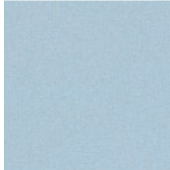
05124.033 BABY BLUE