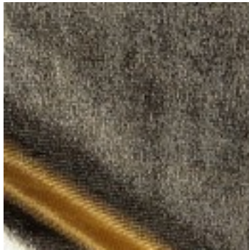
05190.001 LIGHT GOLD