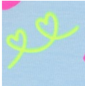
04117.002 LIGHT BLUE