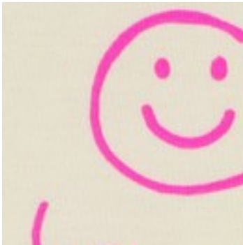
04117.001 OFF WHITE