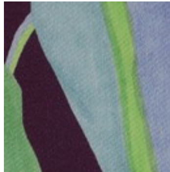
04089.002 DARK PURPLE