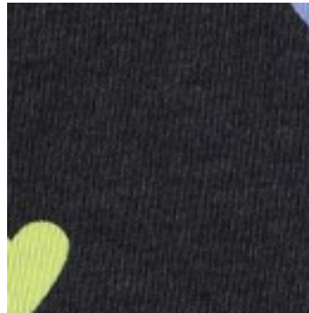
04118.005 INDIGO MELANGE