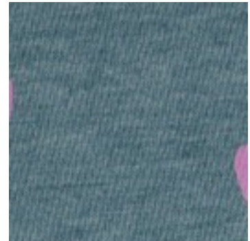
04118.032 SMOKE BLUE MELANGE